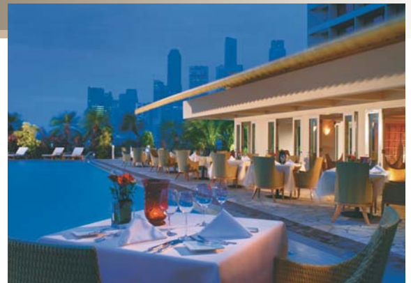
4日間代金(成田・名古屋・大阪・福岡発着)