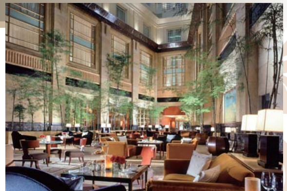
4日間代金(成田・名古屋・大阪・福岡発着)