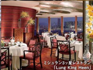
ミシュラン3ツ星レストラン [Lung King Heen]

料理評論家の山本益博氏が実際に現地を選んだ「ミシュラン3ツ星レストラン」や「有名老舗レストラン」での食事を堪能する、まさに美食の旅。ホテルはデラックスのフォーシーズンズホテル香港(デラックスハーバービュー)、フライトは往復ビジネスクラスを利用、往復の送迎はホテルのリムジン(メルセデスベンツ)など、豪華さと優雅さを極めたツアーです。