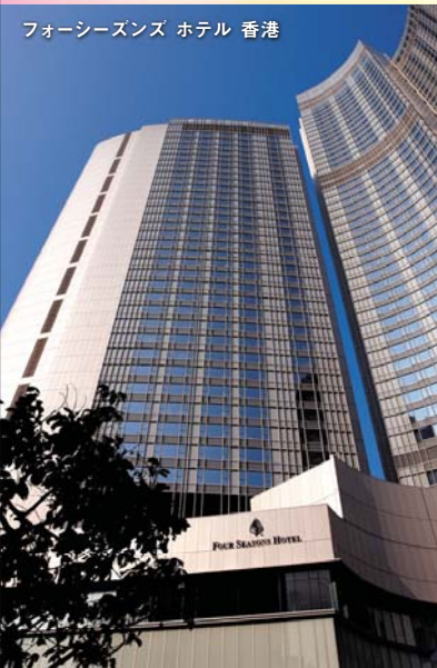
フォーシーズンズ ホテル 香港

※大人1名1室をご利用の場合、60,000円追加となります。※別途、成田空港施設使用料2,040円、成田空港旅客保安サービス料500円、香港国際空港税1,600円、香港空港保安料500円、燃油サーチャージ5,000円(3月10日現在目安額)が必要となります。※空港諸税、燃油サーチャージなどが変更された場合、徴収額を変更する場合がございます。