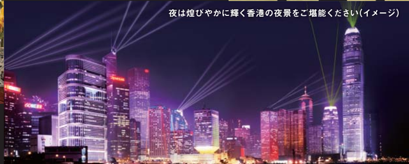
夜は煌びやかに輝く香港の夜景をご堪能ください(イメージ)

香港駅やショッピングモール「FCモール」とも直結し、利便性は抜群。香港で2軒のミシュラン3ツ星レストランを有しているほか、SPAなど宿泊以外の施設も充実しています。ゆとりの広さを誇る客室は、寛ぎの空間を演出する落ち着いたデザインとなっており、ビクトリアハーバーや九龍の景色が一望できます。大理石で造られたバスルームにはロクシタンのアメニティ(※3月現在)、ダブルシンク、液晶TV、独立したシャワーブースを備え、一日の疲れを癒します。