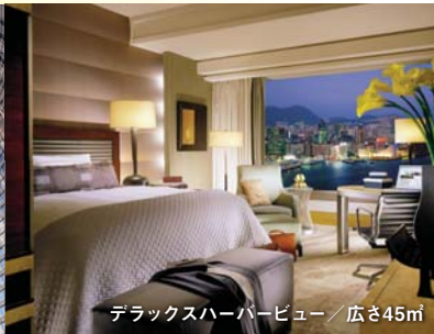
デラックスハーバービュー/広さ45㎡